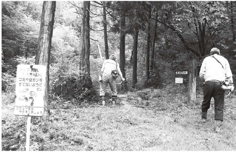
竜王山ハイキングコース清掃